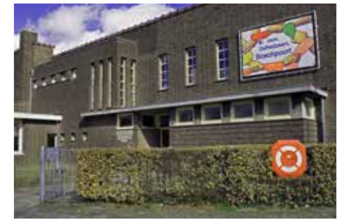
Buurthuis Bosscherveld wint 'Kern met Pit'