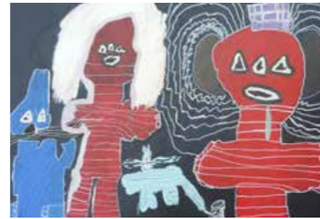
Expositie 'Uit Ut Hoofd' galerie Ut Glaashoes

Adres: Athoslaan 12 A, 6213 CD Maastricht info@athos-maastricht.nl www.athos-maastricht.nl f Athos Eet-Maakt-Doet