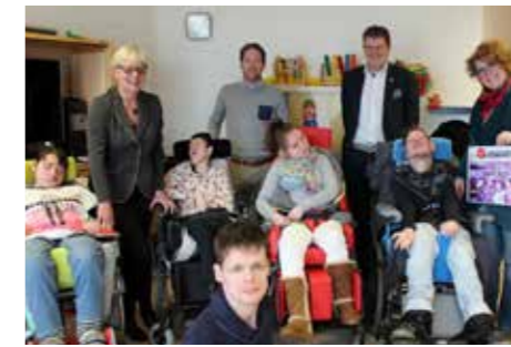
Ronde Tafel 62 doneert aan AC de Kanjel